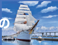
「海王丸と立山連峰」