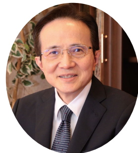
真生会富山病院 院長 耳鼻咽喉科専門医